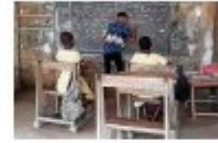
Unerreichte in Ghana, wo Überlegen auch die Mädchen traditionell kurze Haare tragen.

„Das pure Glück kommt in Form von bunten von daher. Oder als Teil ist, wenn Anmut und Helligkeit, jedenfalls den Bergedorferinnen und